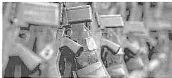
PREVIDÊNCIA No Brasil, os militares recebem o benefício integral após 30 anos de serviços prestados; gratificações podem até dobrar os vencimentos

do salário mais uma parcela complementar contributiva. No Brasil, os militares se aposentam com o salário integral após 30 anos de serviços prestados. A remuneração básica de um soldado vai de R$ 1,5 mil a R$ 1,8 mil e a de um capitão, é de R$ 9 mil e a de um almirante do ar, é de R$ 14 mil. Há, porém, a possibilidade de acumular gratificações que podem até dobrar os vencimentos. O rubro na previdência dos militares das Forças Armadas foi o que mais cresceu no ano passado, de acordo com dados oficiais até novembro de 2018. "Pela falta de uma reforma mais abrangente, o sistema previdenciário para o militar